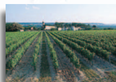
Vignobles de Chinon