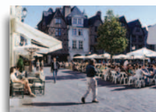
Place Plumereau à Tours