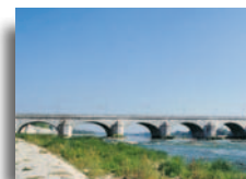
Pont de Blois