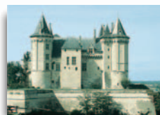
Château de Saumur