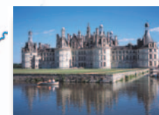
Château royal de Chambord