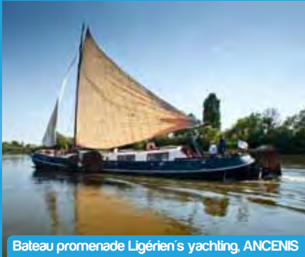
Bateau promenade Ligérien's yachting, ANCENIS