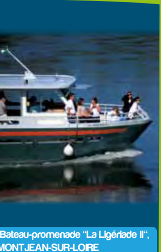
Bateau-promenade "La Ligériade II", MONTJEAN-SUR-LOIRE