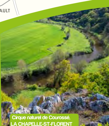
Cirque naturel de Courossé, LA CHAPELLE-ST-FLORENT