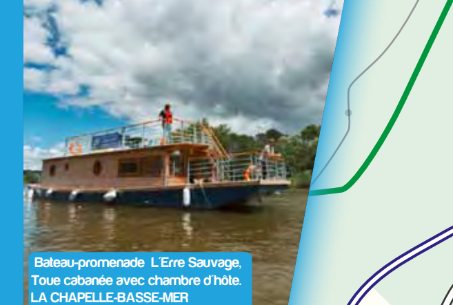
Bateau-promenade L'Erre Sauvage, Toue cabanée avec chambre d'hôte, LA CHAPELLE-BASSE-MER