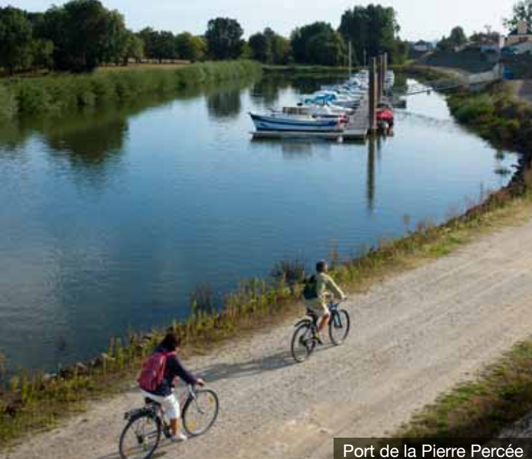
Port de la Pierre Percée