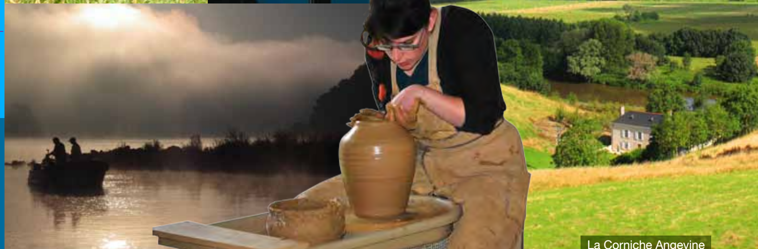
La Corniche Angevine