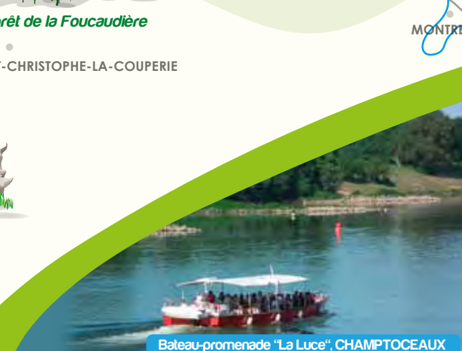
Bateau-promenade "La Luce", CHAMPTOCEAUX