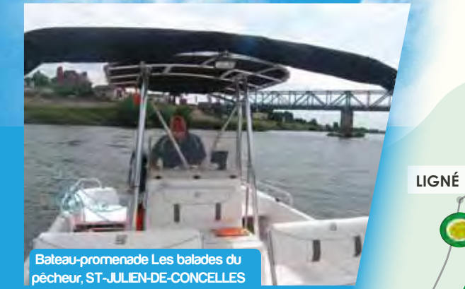
Bateau-promenade Les balades du pêcheur, ST-JULIEN-DE-CONCELLES