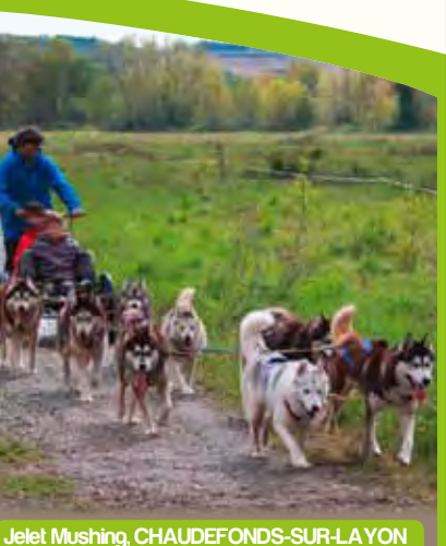
Jelet Mushing, CHAUFONDS-SUR-LAYON