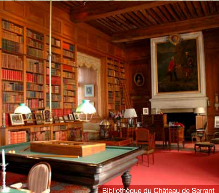
Bibliothèque du Château de Serrant