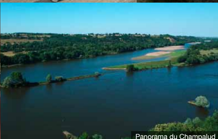
Panorama du Champalud