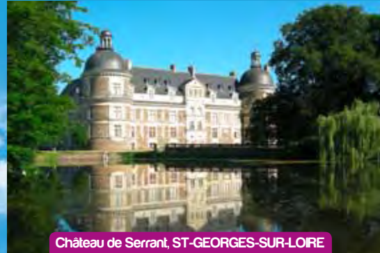
Château de Serrant, ST-GEORGES-SUR-LOIRE