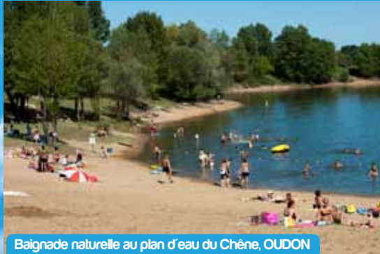
Baignade naturelle au plan d'eau du Chêne, OUDON