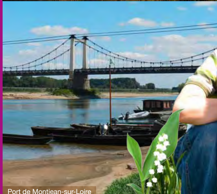
Port de Montjean-sur-Loire