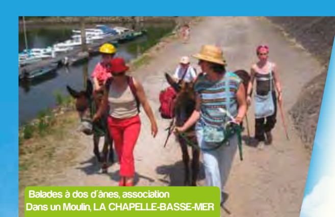
Balades à dos d'ânes, association Dans un Moulin, LA CHAPELLE-BASSE-MER