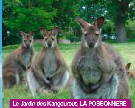
Le Jardin des Kangourous, LA POSSONNIERE