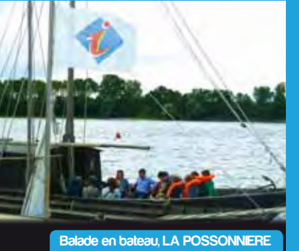
Balade en bateau, LA POSSONNIERE