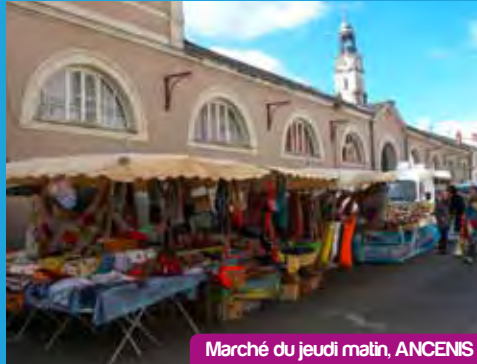
Marché du jeudi matin, ANCENIS