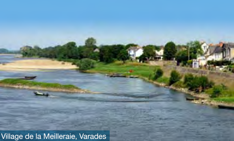
Village de la Meilleraie, Varades