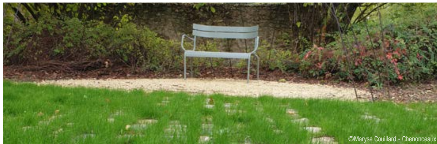
Chenonceaux